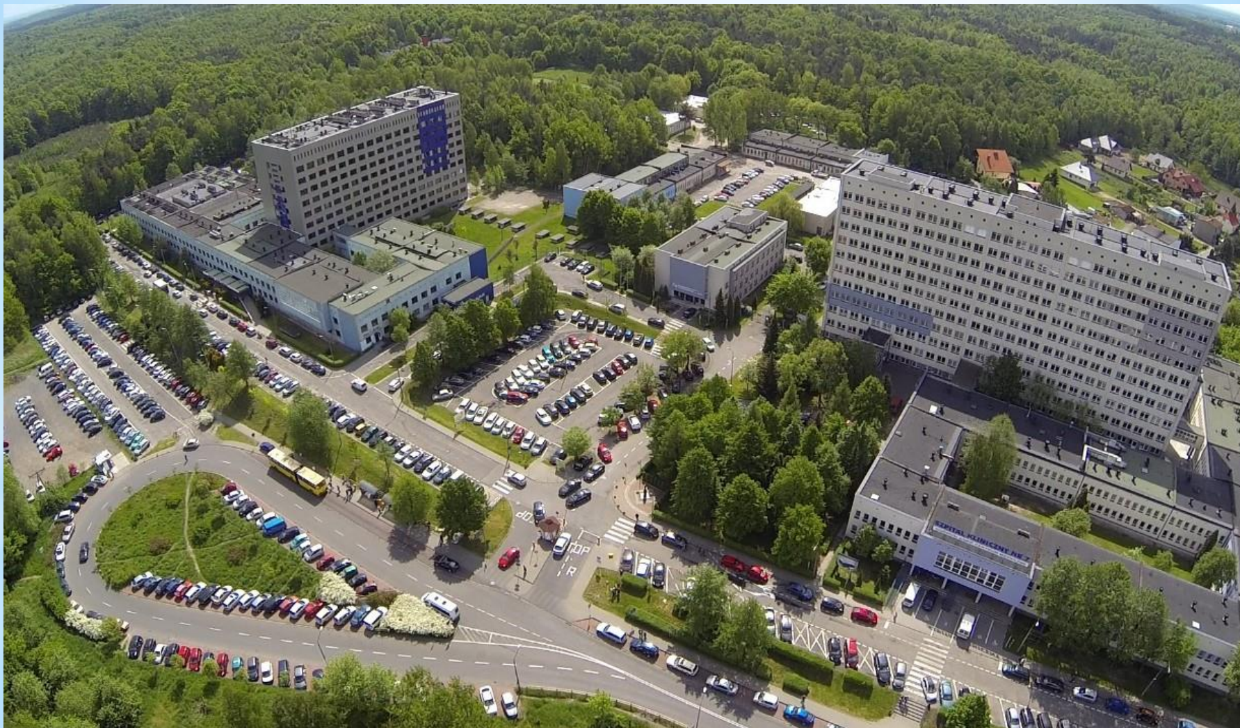
Górnośląskie Centrum Medyczne w Katowicach SPSK nr 7 Śląskiego Uniwersytetu Medycznego