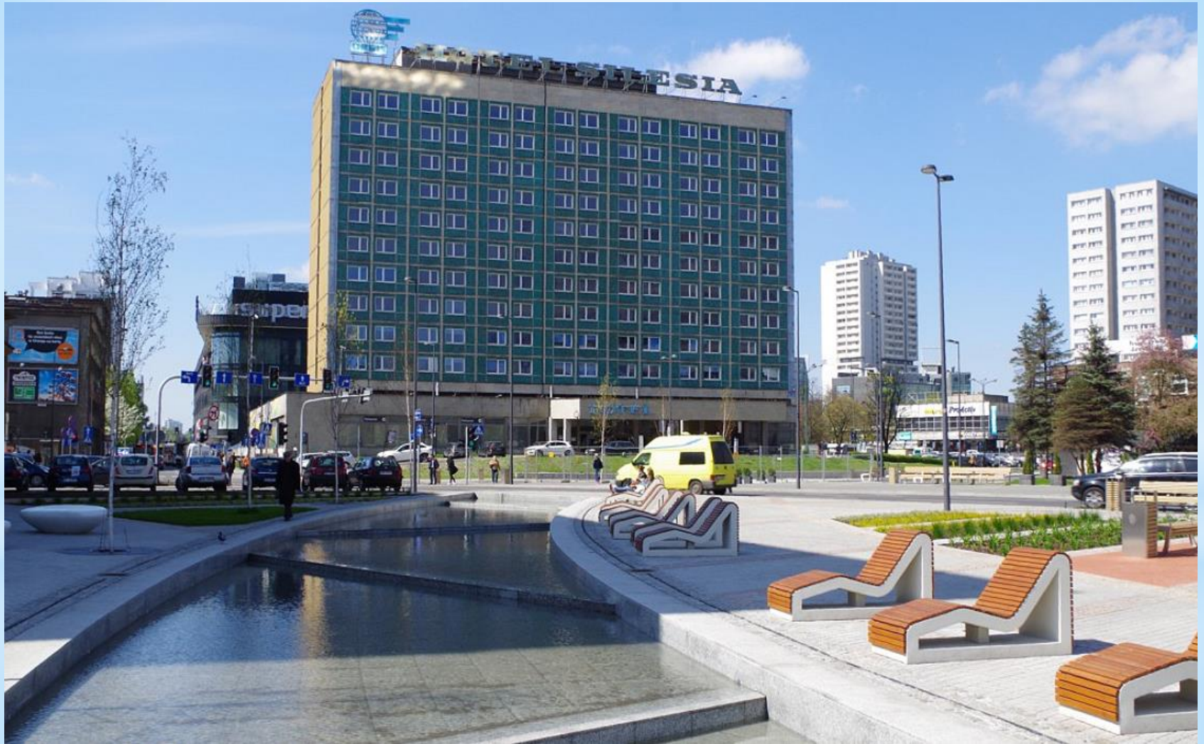
Hotel „SILESIA” - tam nocowaliśmy.